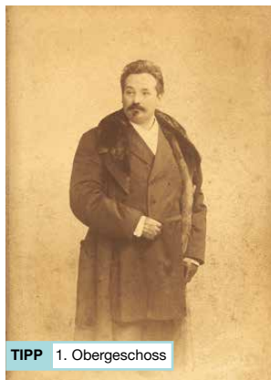
TIPP 1. Obergeschoss