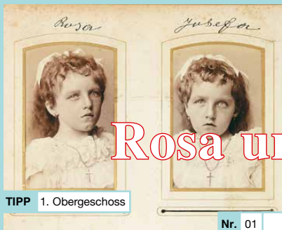
TIPP 1. Obergeschoss