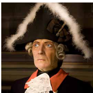
Friedrich der Große (1712 - 1786)