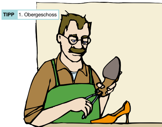
TIPP 1. Obergeschoss