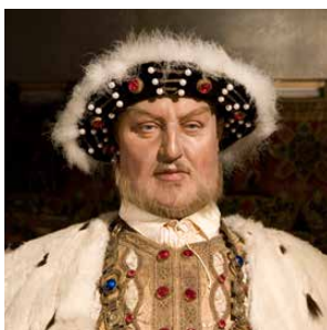
Heinrich VIII (1491 - 1547)

Im Jahre 1517 schlug ich meine 95 Thesen an die Schlosskirche zu Wittenberg. Ich wollte damit gegen den Ablasshandel, den Handel mit Eiern aus Legebatterien und die fehlenden Fahrradwege vor der Kirche protestieren.