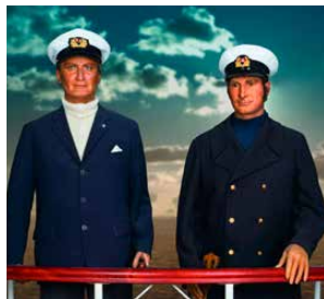
Hans Albers & Freddy Quinn

"GRIECHISCHER WEIN IST SO WIE DAS BLUT DER ERDE"